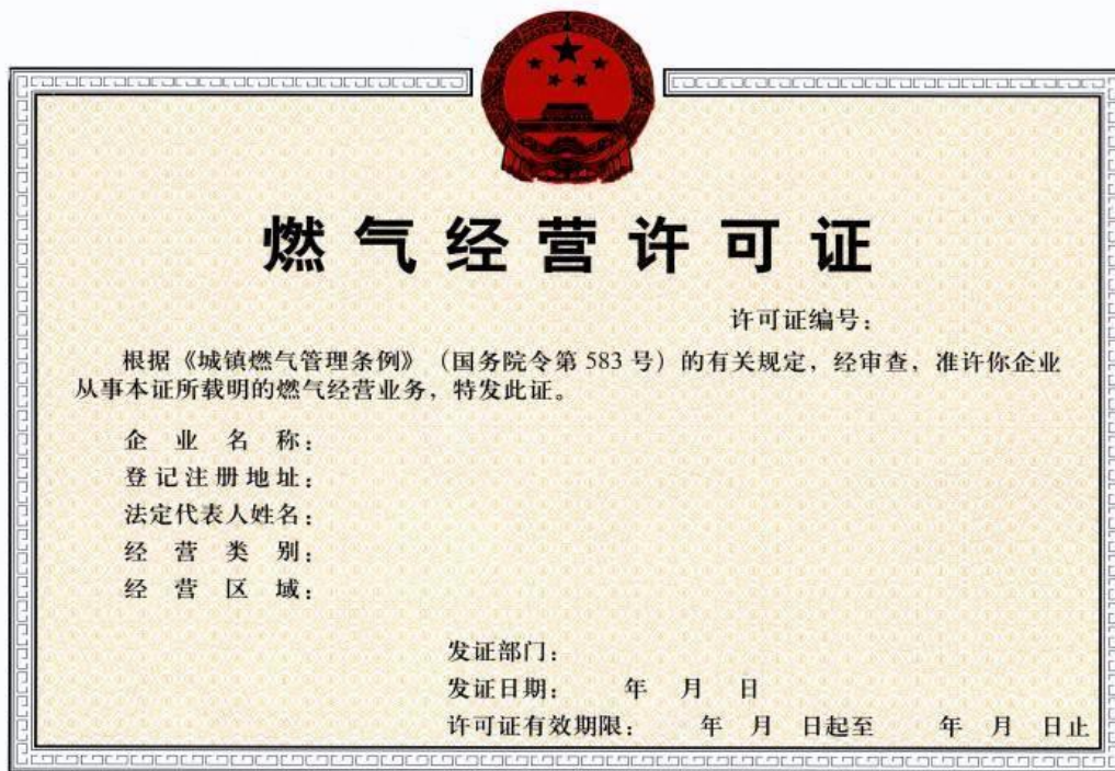
附件 6：燃气经营许可证（样本）